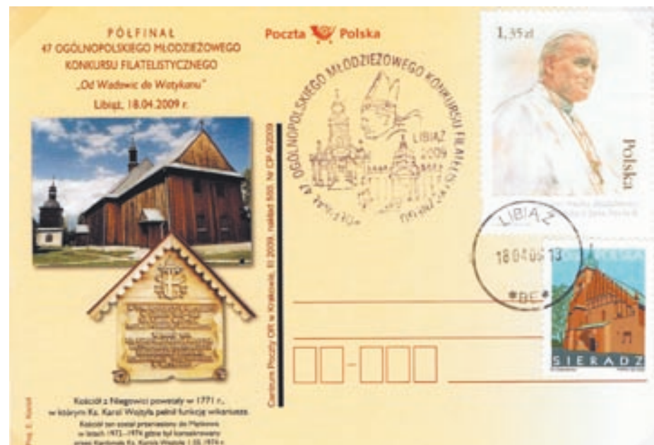
Karta pocztowa beznominałowa i datownik wydane z okazji Półfinałowego Konkursu