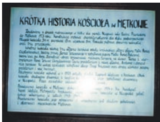
Tablica informacyjna umieszczona wewnątrz kościoła