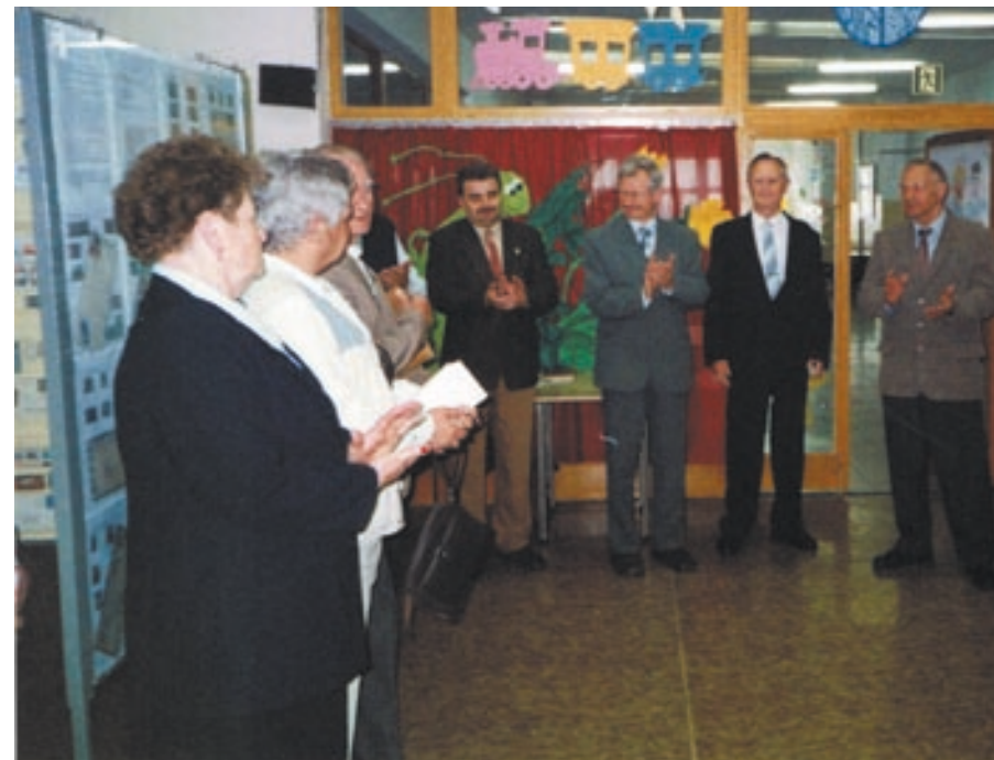
Podczas otwarcia OWF „Libiąż 2004”

W dniach 18-24 maja 2004r. została zorganizowana OWF „Libiąż 2004”, wystawa niekonkursowa. Wystawę zorganizowano z okazji: 84 rocznicy urodzin Papieża Jana Pawła II. Na wystawie prezentowano 9 eksponatów o różnej tematyce. Organizatorzy wydali Kopertę okolicznościową z nadrukiem, natomiast Poczta Polska stosowała datownik okolicznościowy, nalepkę „R” polecenia z okolicznościowym nadrukiem i wydała kartę pocztową beznominałową.