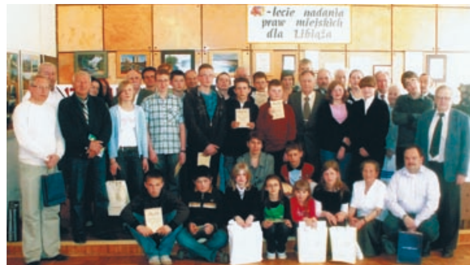
Uczestnicy konkursu, opiekunowie, Członkowie Komisji Konkursowej, organizatorzy i zaproszeni goście